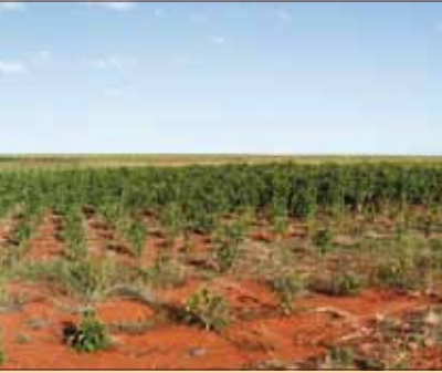
Madagascar. Piantagione di jatropha nei dintorni del villaggio di Satrokala, Regione di Ihorombe, a sinistra; villaggio di Ambararatabe, Regione di Ihorombe, a destra.