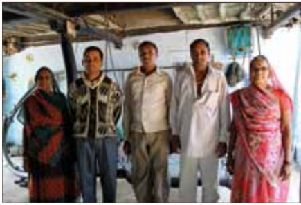
A sinistra: Alcuni attivisti del NBA.