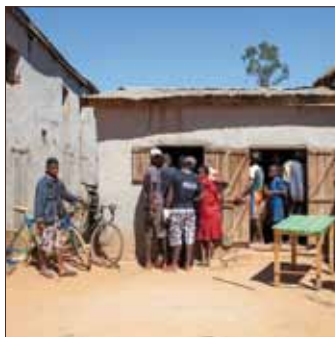
Madagascar. Istantanea del villaggio di Ambatolahy, Regione di Ihorombe, sopra, e villaggio di Ivaro West, Regione di Ihorombe, sotto.