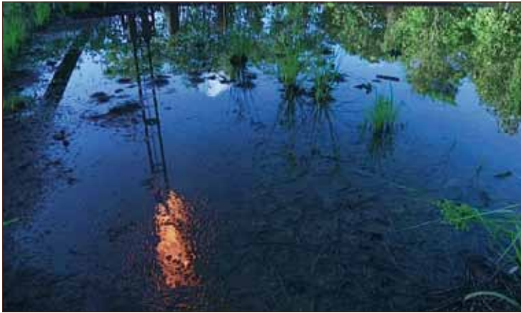
Gas flaring riflesso nelle acque torbide, Lago Agrio.

tante delle decisioni che hanno impatti sulla nostra vita quotidiana, e anche sulla quella di chi in questo luogo non ci abita. Neanche l'Europa è un'entità lontana e fatta da sconosciuti: ai diversi Consigli siedono anche i nostri Ministri, espressione del nostro governo. Così come al Parlamento siedono anche i deputati italiani, eletti da noi. Inoltre possiamo far sentire la nostra voce decidendo di utilizzare i meccanismi che già esistono, come il diritto d'iniziativa dei cittadini europei che consente ad un milione di cittadini dell'Unione di prendere direttamente parte all'elaborazione delle politiche dell'UE, invitando la Commissione europea a presentare una proposta legislativa.