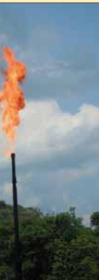
Gas flaring nei dintorni di Lago Agrio, sopra. Un'indigena che abita nel parco Yasuní, sotto.