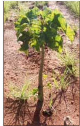
A destra: piantina di Jatropha nei dintorni del villaggio di Satrokala, regione di Ihorombe, Madagascar.

22 necessario mettere in atto un processo trasformativo anche a livello delle istituzioni pubbliche chiamate ad esercitare il loro ruolo nel segno della promozione dei diritti umani e dei principi di equità e giustizia. A questo proposito riteniamo che le istituzioni deputate a farlo si debbano adoperare per la cessazione dei fenomeni di concentrazione e accaparramento della terra, anche attraverso la promozione dell'agricoltura ecologica e di piccola scala. Esse si devono adoperare per il rafforzamento dei processi di implementazione reale dell'acqua come diritto fondamentale, la cui gestione deve essere sottratta ai privati e il cui accesso deve essere universale. Rivendichiamo la necessità di una transizione verso un nuovo modello energetico basato su fonti rinnovabili e diffuse e la necessità di adottare misure per porre un freno alla speculazione sulle risorse naturali, ridefinendo regole stringenti per i mercati finanziari. Chiediamo infine l'adozione urgente di un accordo per combattere i cambiamenti climatici che sia vincolante per tutti i paesi, secondo il principio della responsabilità condivisa ma differenziata e del ripianamento del debito ecologico che i paesi del Nord del mondo hanno accumulato.