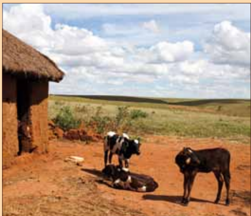
Madagascar. Capi di zebù nel villaggio di Bemavo, Regione di Ihorombe, sopra; stabilimento della Tozzi Green, villaggio di Satrokala, regione di Ihorombe, al centro.